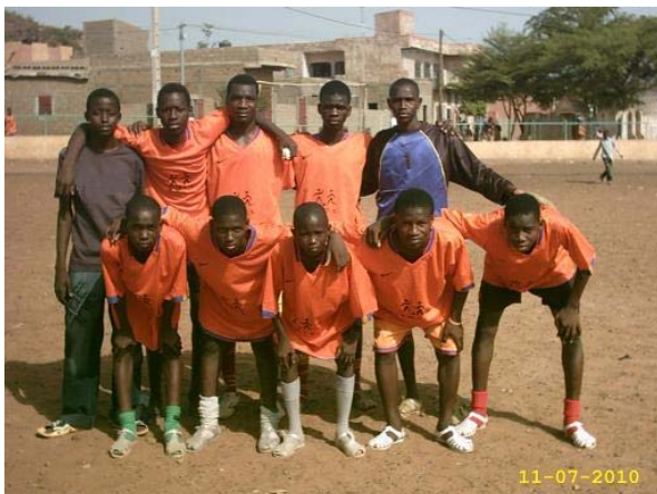
Het WK-2010 leeft natuurlijk ook bij het Centre d'Écoute!

Doorgaan en verder professionaliseren, continuïteit en integriteit waarborgen. Maak gebruik van de aangeboden hulp.