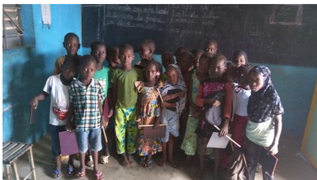
Klasfoto door Sidy Diarra